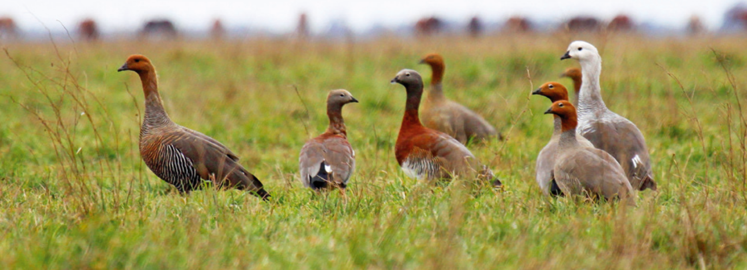
Las tres especies de cauquenes migratorios: a la izquierda, hembra de cauquén común; en el centro cauquenes reales y a la derecha en primer plano, cauquenes colorados; detrás un macho de cauquén común.