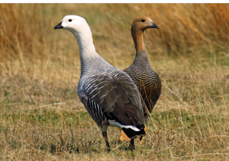
Pareja de cauquenes comunes