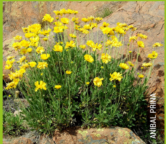
Las Margaritas Pampeanas se encuentran adaptadas a crecer en los intersticios provocados por las fractura de las rocas o entre ellas.