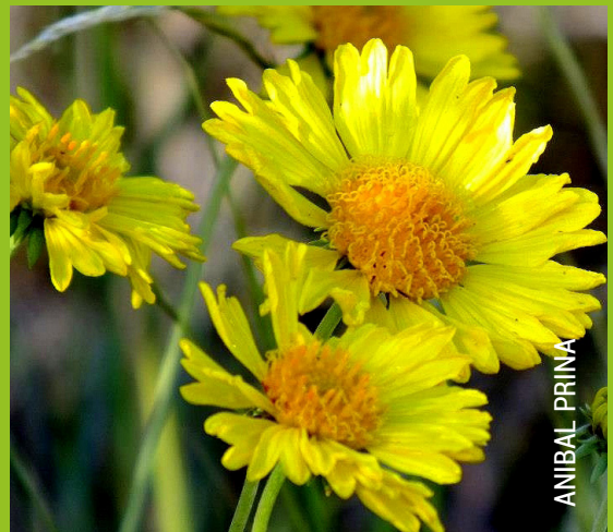
Detalle de los capítulos de la Margarita Pampeana, cada uno de ellos porta numerosas flores minúsculas.

En la provincia de La Pampa habitan al menos cinco especies de plantas endémicas, tres de ellas en el PN Lihué Calel. Considerando que entre el 20 y el 40% de las especies de plantas a nivel mundial presentarían algún tipo de amenaza, conocer en profundidad nuestra flora local, enfatizando particularmente los estudios sobre aquellas de carácter endémico, es de vital importancia para la conservación y puesta en valor esta parte imprescindible del acervo cultural de todos los pampeanos.