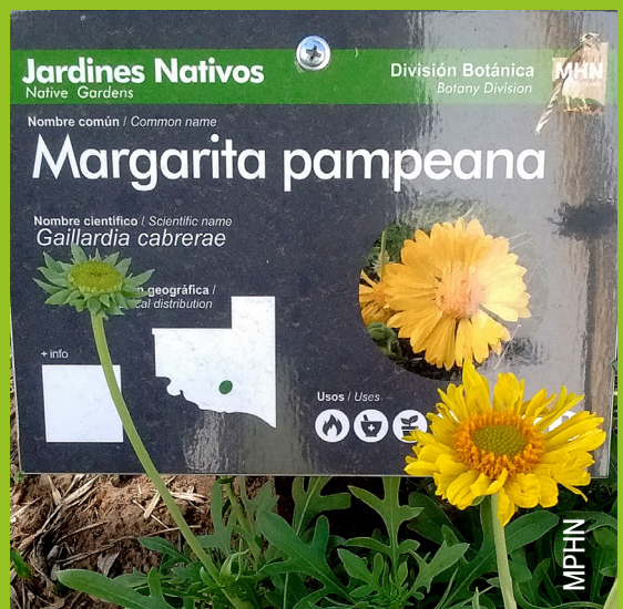
Margaritas Pampeanas cultivadas con fines educativos en los Jardines Nativos del MPHN.